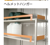
棚落下防止ガード